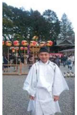
二荒山神社の渡春祭（おたりやさい）に参加！

1983年宇都宮市生まれ。陽南中学校、宇都宮高校、早稲田大学政治経済学部卒業。在ジョージア・在タジキスタンの日本国大使館や東日本大震災の被災地での勤務、松下政経塾を経て、立憲民主党栃木県第1区（衆議院）総支部長に就任。