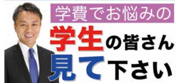
新型コロナに負けない動画を作成し、YouTubeで配信！