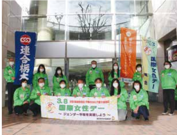
連合栃木の皆様と国際女性デーの合同街宣を実施