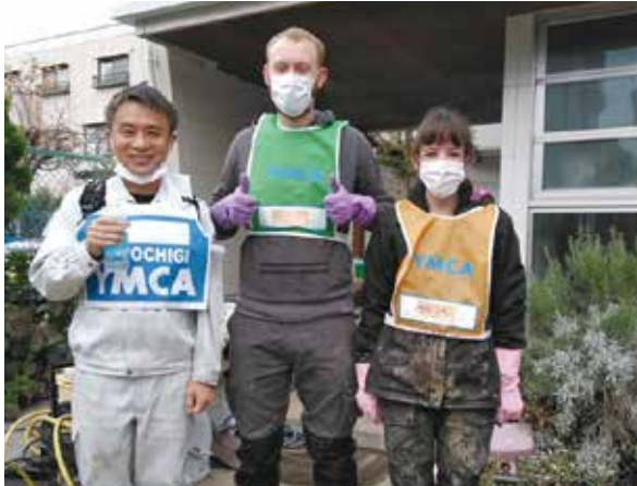
台風19号で被害のあった田川流域でのボランティア